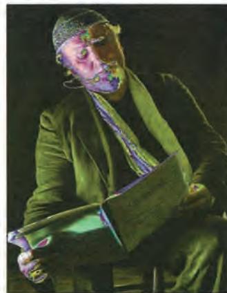
Moni Ovadia a Dante2021

vatores, Daniele Luchetti, Paolo Virzi e altri ancora. Ha vinto due David di Donatello (nel 1998 come attore non protagonista; nel 2006 come miglior attore),