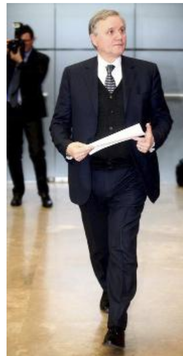
Ignazio Visco, governatore della Banca d'Italia, l'11 settembre terrà una conferenza: "Note sull'economia di Dante e su vicende dei nostri tempi"

All'incontro di ieri è intervenuto anche Ernesto Giuseppe Alfieri, presidente della Fondazione, che ha sottolineato come, dopo un anno di pausa a causa della pandemia, «Dante 2021 torni con un programma ricchissimo e di particolare levatura». La cornice sarà sempre quella suggestiva degli Antichi Chiostrini Francescani, nel cuore della zona dantesca, a pochi passi