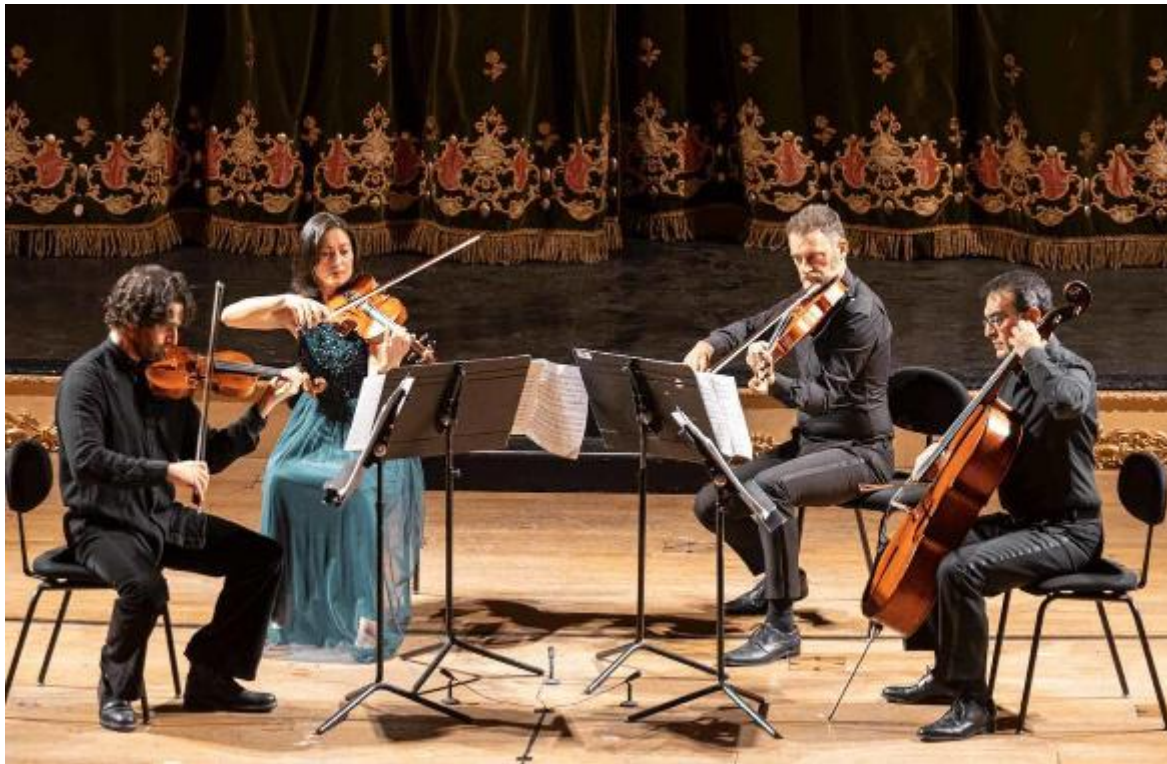
Il Quartetto Dafne arriverà alla sala Corelli il 6 settembre, appuntamento in collaborazione con l'Associazione Mariani