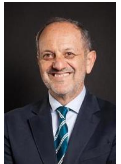
Guido Tonelli, fisico del Cern di Ginevra (ospite l'8 settembre)