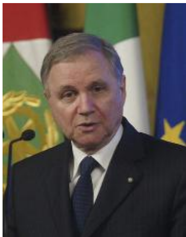
Il governatore della Banca d'Italia, Visco

Terrà un discorso sul tema «Note sull'economia di Dante e su vicende dei nostri tempi»