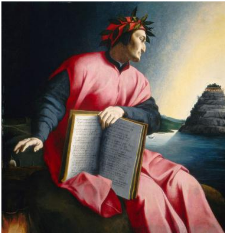
Il ritratto di Dante realizzato dal Bronzino (1503-1572) intorno al 1532