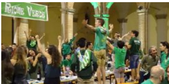
Una delle cene propiziatorie al rione Verde