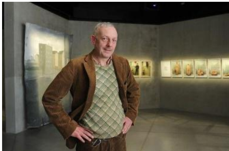
L'artista Paolo Ventura autore del progetto

Paolo Ventura, cresciuto artisticamente nella Grande Mela, oggi vive fra Milano e Anghiari. Dall'unione di pittura, ricerca storica, artigianato, composizione scenografica, citazioni di artisti del passato e una grande attenzione per la storia e le tecniche della fotografia, l'artista genera narrazioni surreali, tragiche, dense di memoria ma anche